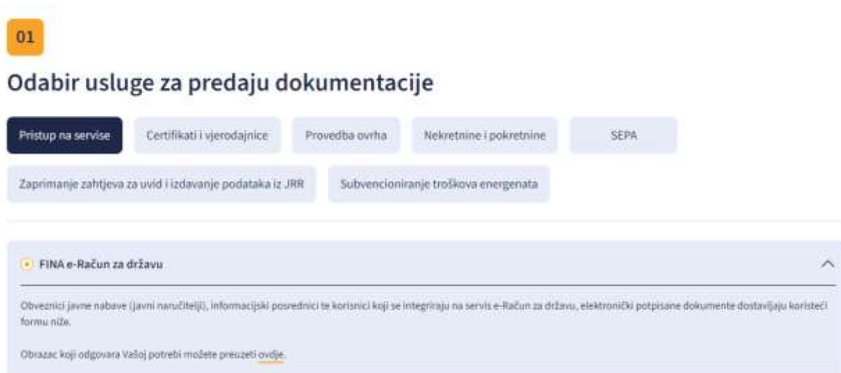
Slika 3. - Prikaz detalja usluge

Klikom na kvadratić usluge pojavljuje se kratki opis i dodatne upute, kako bi korisnik lakše odabrao uslugu koju treba i pripremio dokumentaciju za slanje, kao što prikazuje Slika 3.