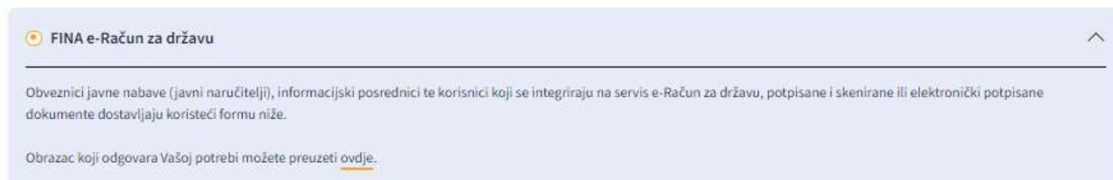
Slika 4. - Odabrana usluga

U konačnici željena usluga odabire se klikom na kružić pokraj njezina imena kao što prikazuje Slika 4.