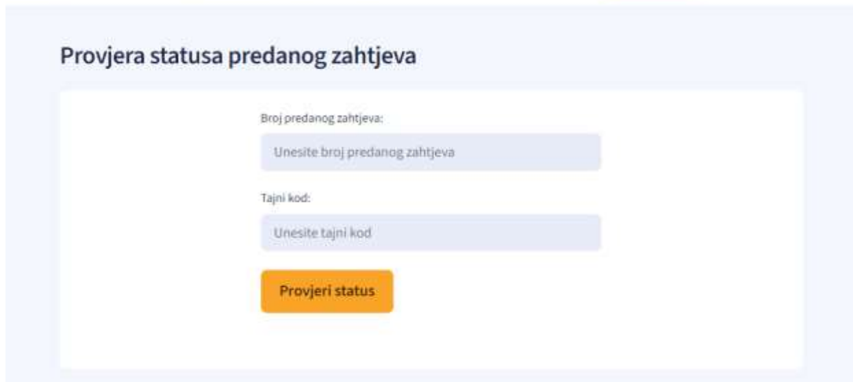
Slika 11. - Ekran za provjeru statusa

Nakon upisivanja ispravne kombinacije broja predanog zahtjeva i tajnog koda, korisnik odabire gumb Provjeri status , nakon čega se prikazuje trenutni status zahtjeva koji može biti jedan od sljedećih: