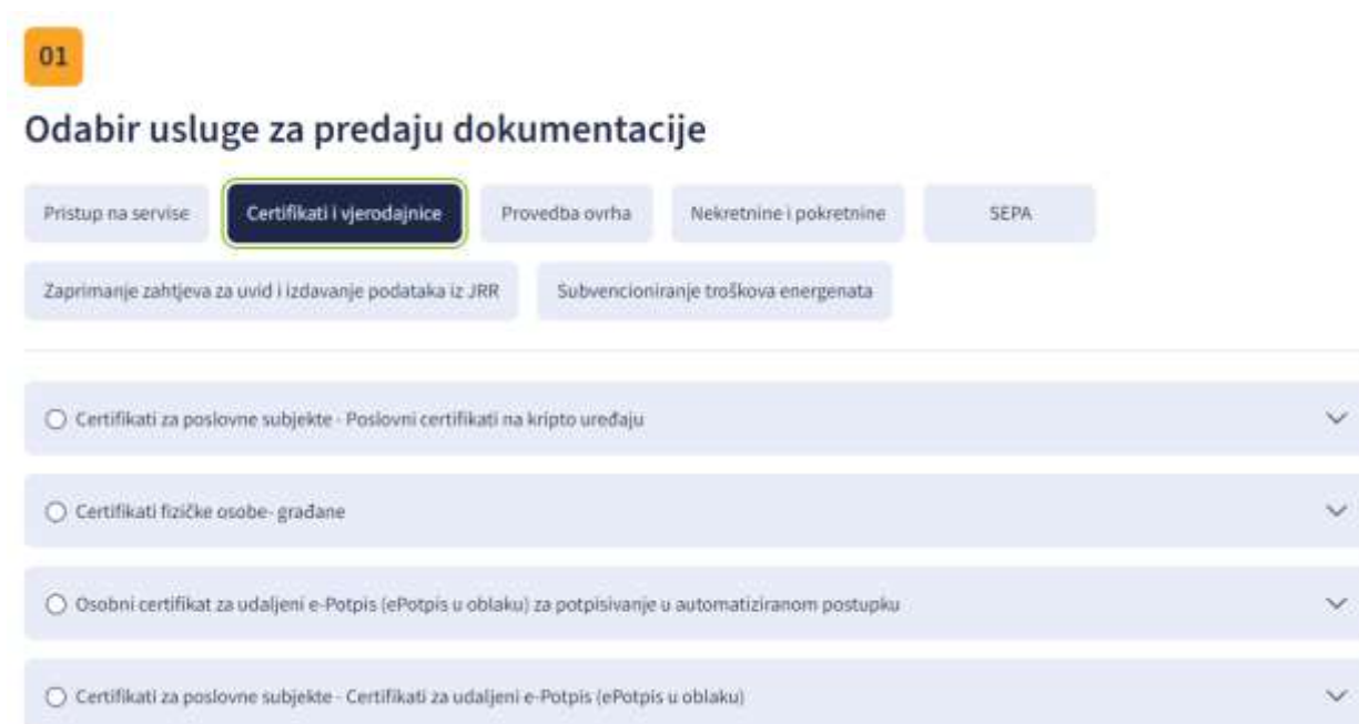
Slika 2. - Filtriranje po kategoriji usluge

Klikom na jednu od kategorija usluga aktivira prikaz samo onih usluga iz odabrane kategorije kao što prikazuje Slika 2.