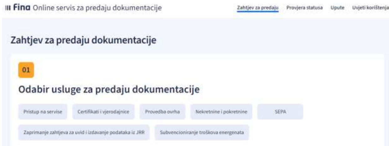
Slika 1. - Odabir usluge za predaju dokumentacije

U prvom koraku potrebno je odabrati uslugu za koju se želi predati dokumentacija. Ovaj segment se sastoji od dva dijela: popis kategorija po kojima je moguće dodatno filtrirati usluge te popis usluga (Slika 1).