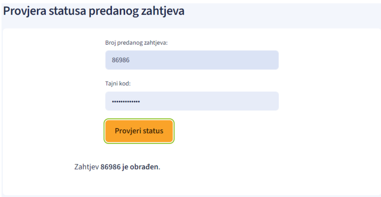
Slika 13. - Rezultat provjere statusa bez priloženog dokumenta s dodatnim informacijama

Slika prikazuje izgled ekrana kada uz zahtjev sa statusom Obraden nema priloženog dokumenta s dodatnim informacijama, već se prikazuje samo informacija o statusu zahtjeva.